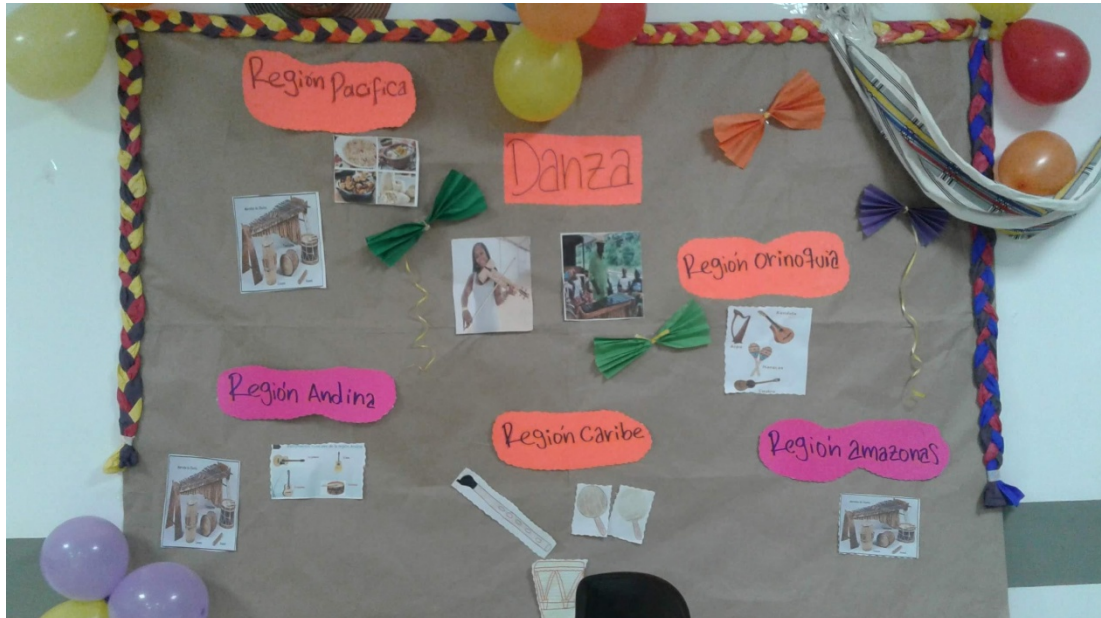
Imagen 5: Clase de “Expresión corporal” en CECAR, registro propio, marzo de 2020.

En torno a actividades enmarcadas en proyectos de la Universidad, fui a visitar el Centro de Desarrollo Infantil (CDI) “Hijos de la Sierra Flor” en un barrio popular de Sincelejo. Esta institución que con más de 30 años se ocupaba de la enseñanza a los niños y niñas de 2 a 5 años. En esta visita una de las docentes me recibió y comentó acerca de cómo se trabaja en este lugar. Las salas estaban divididas por edades y el principal objetivo que guía todas las actividades planificadas es la creatividad y el protagonismo de los niños y niñas en todas las creaciones, lo cual se encontraba en plena relación con mi investigación doctoral.