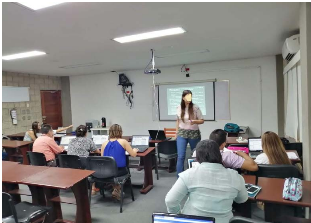
Imagen 2: Capacitación de software Atlas.Ti , registro propio, marzo de 2020.

En relación a la carrera de Pedagogía infantil asistí a la clase de “Rondas y Cantos” a cargo de la docente Shirley Dávila. Durante este encuentro los y las estudiantes realizaron actividades con canciones para niños y niñas a lo cual me sumé comentando acerca de las canciones infantiles de