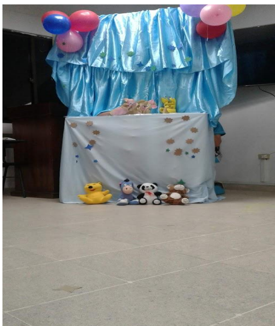
Imagen 4: Participación en la clase “Expresión corporal”, registro propio, marzo de 2020.

En CECAR fui parte de la clase de “Expresión corporal” del Programa de Pedagogía. En esta actividad las estudiantes del curso divididas en grupos hicieron presentaciones de obras de títeres para niños y niñas.