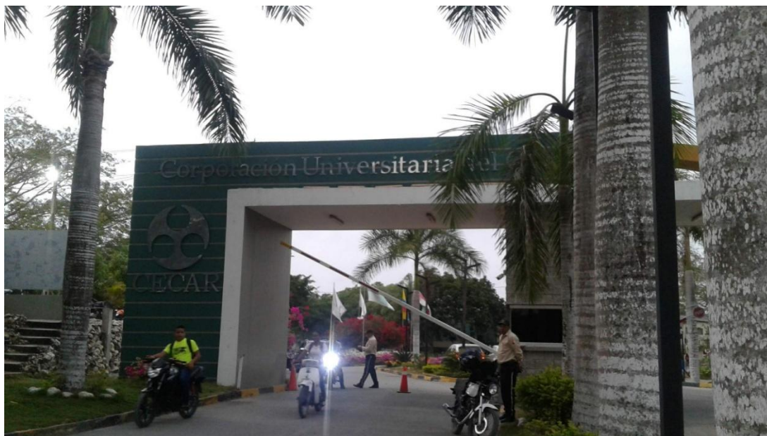
Imagen 1: entrada de la Corporación Universitaria del Caribe (CECAR), registro propio, marzo de 2020.

El marco general que guió esta experiencia fue mi tesis doctoral, la cual abordó aspectos relacionados con infancias, creatividad, territorios y construcciones colectivas, a grandes rasgos.