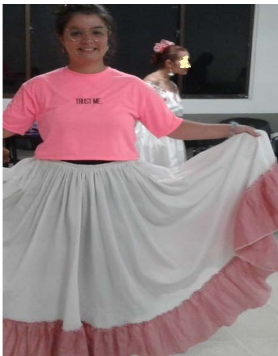
Imagen 3: Participación en la clase “Rondas y Cantos”, registro propio, marzo de 2020.

En este encuentro luego de las actividades lúdicas se pasó a una explicación teórica por parte de la docente en la cual se habló de la importancia de mantener vivos los cantos y rondas de Colombia, así como el papel fundamental de este tipo de expresiones en los niños y niñas en la primera infancia.