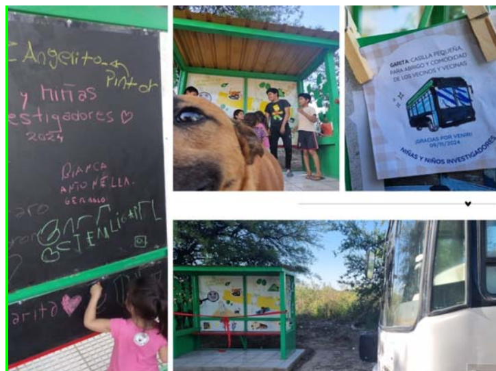
Imagen 2 – Composición con imágenes propias, 2024

En la inauguración se expusieron fotografías y mensajes de agradecimiento elaborados por lxs niñxs, junto con palabras del intendente. La entrada del colectivo y el recorrido por los alrededores del barrio fueron momentos emotivos para lxs adultxs y de disfrute para lxs niñxs. Como recuerda Bourdieu (2014), las acciones y relaciones que el Estado compromete, producen marcos de memoria y afectos comunes, que unen y separan, en lugares y tiempos específicos.